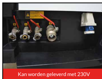
Kan worden geleverd met 230V