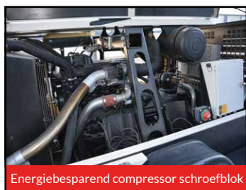
Energiebesparend compressor schroefblok