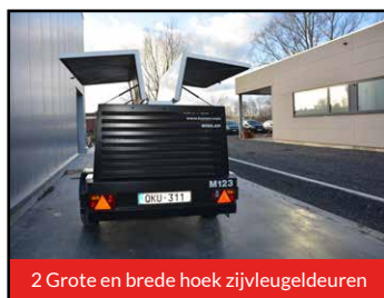
2 Grote en brede hoek zijvleugeldeuren