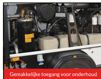
Gemakkelijke toegang voor onderhoud